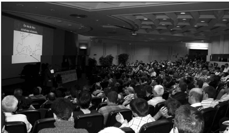
VII Jornadas de caza.