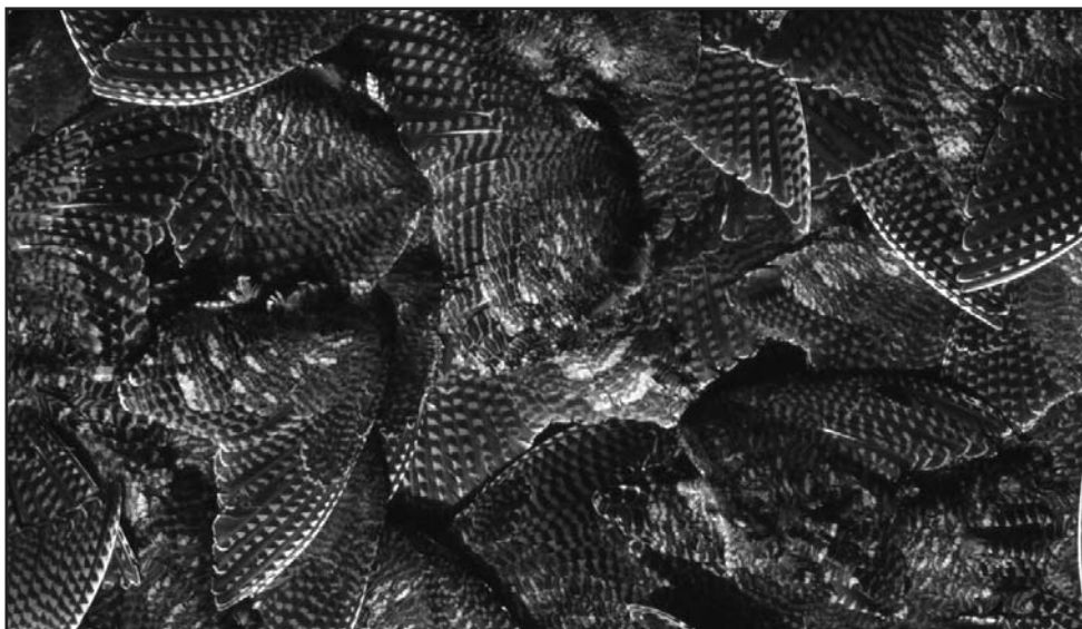
Alas de becada.

AVISO LEGAL: En cumplimiento de la Ley Orgánica 15/1999 de Protección de Datos de Carácter Personal, se informa de que la Asociación de Cazadores de Navarra (en adelante ADECANA) es titular de un fichero sito en Pamplona en la calle Iturruma nº 18-1ºB CP 31007 del que son parte integrante los datos utilizados para remitirle la revista, con la finalidad de gestionar el envío de la publicación y cuantos aspectos se puedan derivar de la misma, así como para la finalidad de envío de comunicaciones comerciales de productos y servicios que el titular pueda en su caso ofrecer, a lo cual se entenderá que usted presta el oportuno consentimiento para dicho tratamiento con las finalidades antes mencionadas si en el plazo de quince días naturales desde la recepción de la presente usted no se opone a dicho tratamiento, señalándole igualmente que puede oponerse al tratamiento de datos para otras finalidades que no sean las relativas al envío de esta revista, debiendo manifestar dicha circunstancia de la forma antes mencionada. De conformidad con lo dispuesto en el artículo 5 de la Ley Orgánica se le comunica que respecto a los datos de carácter personal recogidos para su tratamiento tiene la posibilidad de ejercitar los derechos de acceso, rectificación, cancelación y oposición, mediante solicitud dirigida por escrito al titular del fichero a la dirección postal arriba indicada en los términos que suscribe la legislación vigente.